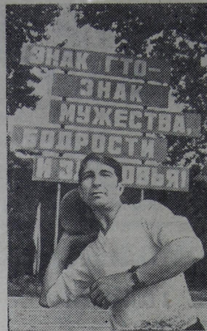
Спортивный клуб объединения Ленинградского металлургического завода «Турбострой-