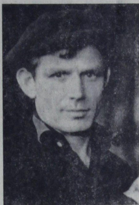
Навстречу 30-летию великой Победы

Коллективы, награжденные Памятным знаком ЦК КПСС, Совета Министров СССР, ВЦСПС и ЦК ВЛКСМ, занесутся на Всесоюзную доску почета на ВДНХ СССР.