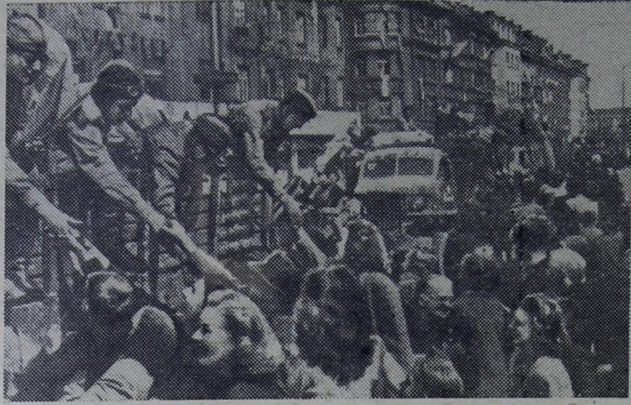
На снимке: сердечная встреча. Советские воины — освободители.