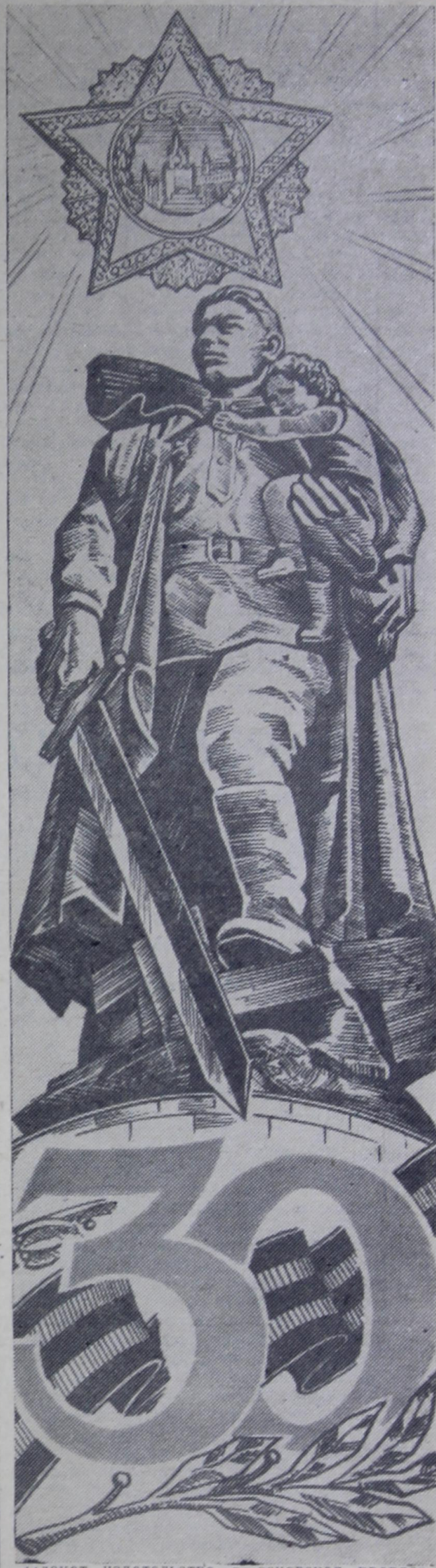
Плакат издательства «Московская правда».

Завтра, 8 мая, в 19 часов, во Дворце культуры гидростроителей состоится общегородское торжественное собрание, посвященное 30-летию Победы советского народа в Великой Отечественной войне 1941—1945 годов.