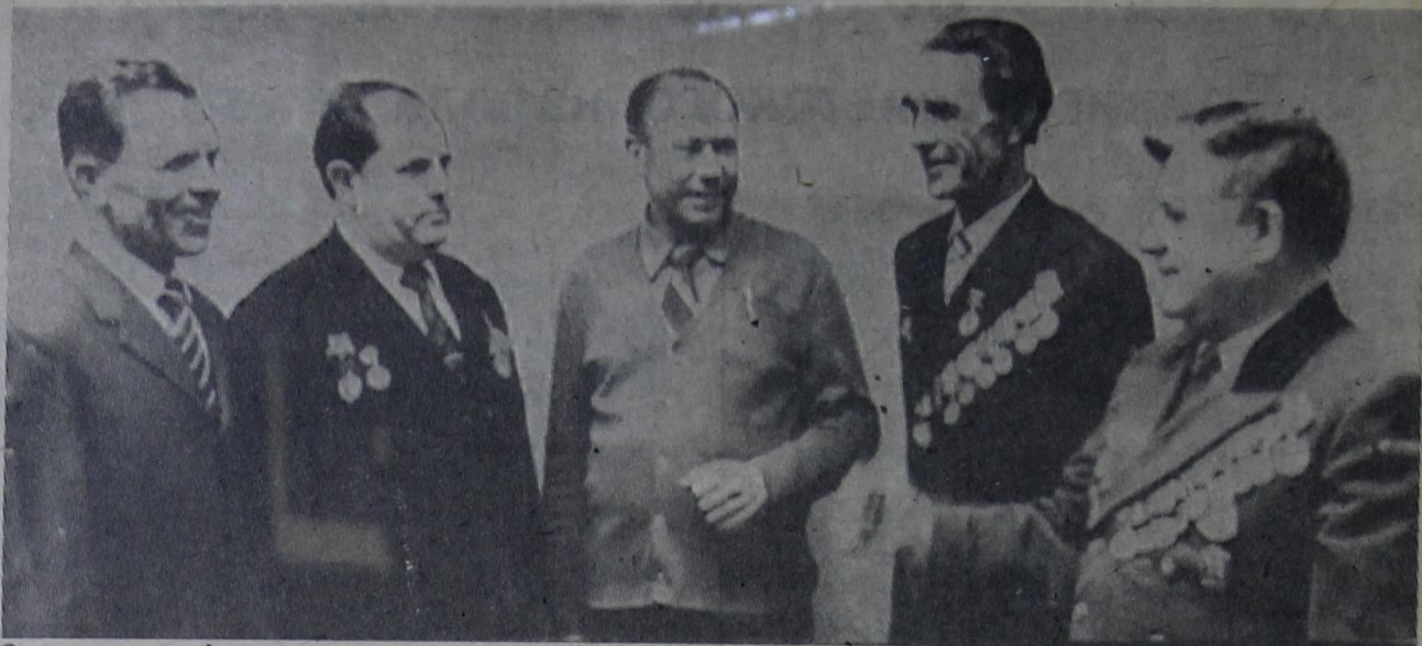
В коллективе УПТК — 27 участников Великой Отечественной войны. Их фотопортреты оформлены на специальном стенде.