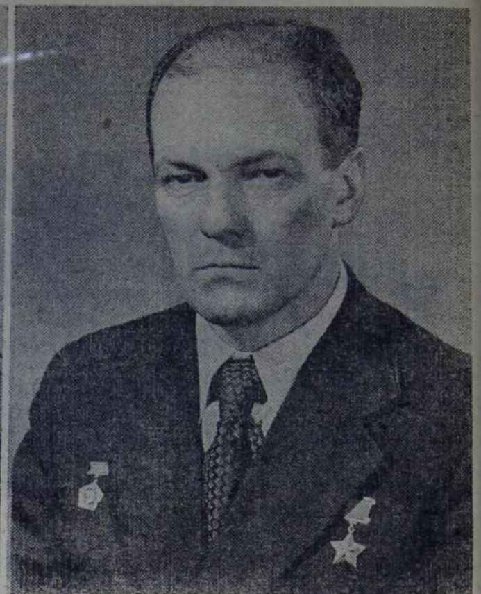
«Союз-16» Николай Николаевич Рукавишников, летчик-космонавт СССР, Герой Советского Союза.