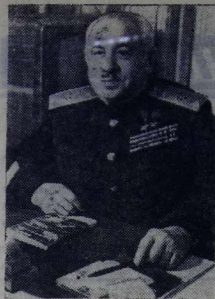
Наш календарь И. Д. ПАПАНИН

На XVII отчетно-выборной конференции с возросшей силой, с новыми примерами звучали выступления делегатов. Они делились мнениями об успехах и промахах в работе, выдвигали предложения по улучшению коммунистического воспитания молодых строителей, организации культурного отдыха, спорта. Говорили о самых злободневных проблемах, решение которых зависело от самих ребят, так и от комсомольских комитетов. Общим и для докладчика и выступлений делегатов было главное требование — активизировать всю комсомольскую работу в свете постановлений XXIV съезда КПСС и XVII съезда ВЛКСМ.