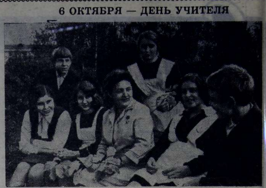
6 ОКТЯБРЯ — ДЕНЬ УЧИТЕЛЯ

А монтажникам нашего участка день ото дня становится все труднее. Габаритное оборудование приходится передвигать, по-