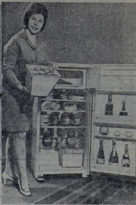
Красноярский машино-строительный завод «Красмаш» начал выпуск холодильников «Бирюса-5». По сравнению со своими предшественниками новый холодильник имеет большую емкость морозильной камеры. В нем установлены современные приборы автоматической регулировки режима работы, введена полуавтоматическая система оттаивания.