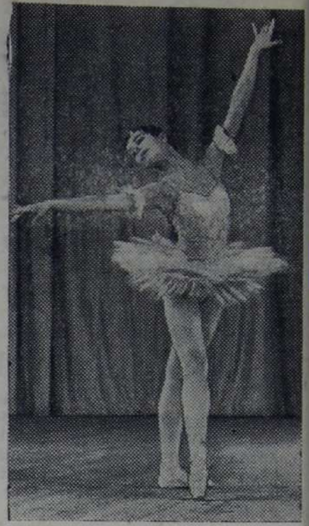
Надя Павлова делегат XVII съезда ВЛКСМ.

С балетной труппой Большого театра Союза ССР Надежда Павлова гастролировала в Соединенных Штатах Америки, потом выступала в Польше, в Голландии и в Австрии.