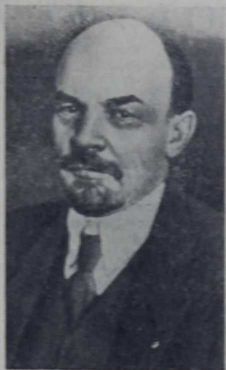
В. И. Ленин (1918 год).

Памятной датой в летописи Балакова и области вошло награждение нашей стройки орденом Ленина. В ответ на столь высокую оценку преобразователя Балакова и Поволжья с удвоен-