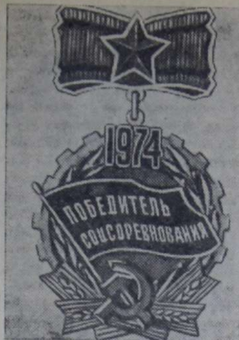
Знак «Победитель социалистического соревнования 1974 года».

№ 21 (1476) ♦ Суббота, 16 марта 1974 года ♦ Цена 1 коп.