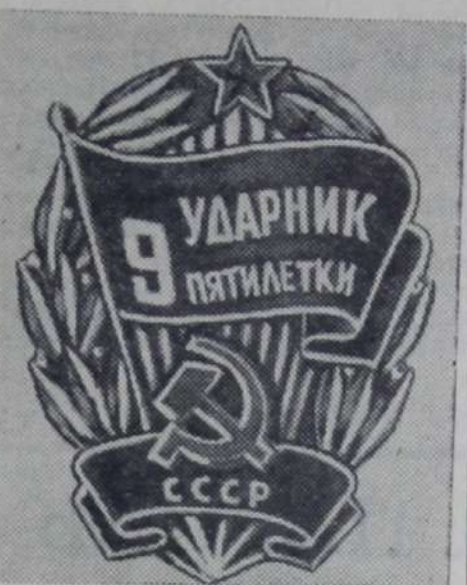
Знак «Ударник девятой пятилетки».