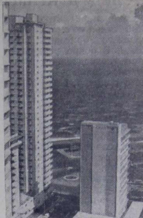
Знаменитый ему и сопровождающим его товарищам. На снимке: Куба. Набережная Малекон в Гаване.

Л. И. Брежнев выразил искреннюю благодарность Центральному Комитету Коммунистической партии Кубы и Революционному правительству Республики Куба, всему кубинскому народу за горячий, братский прием, ока-