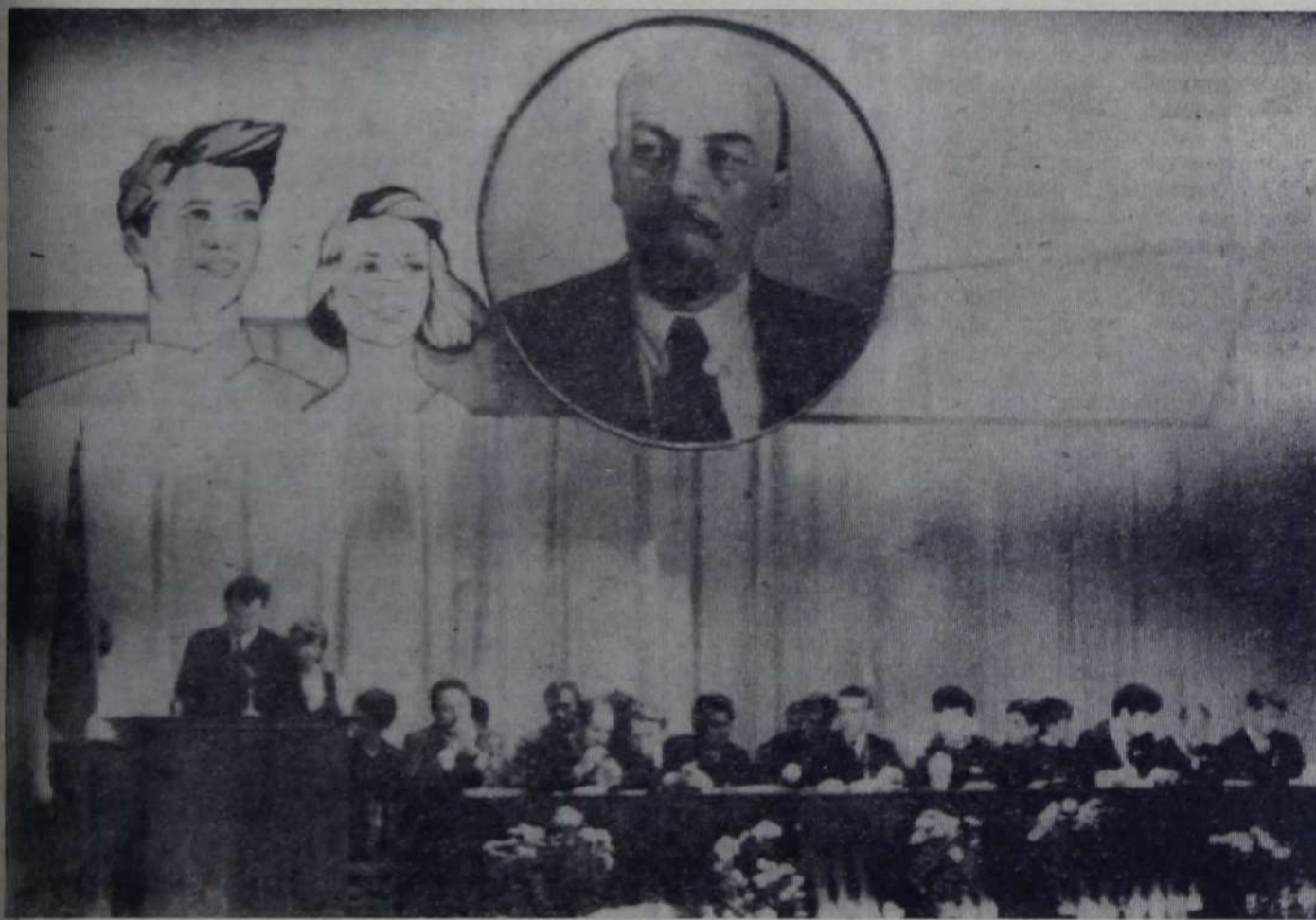
В президиуме XV отчетно-выборной комсомольской конференции Саратовгэсстроя.