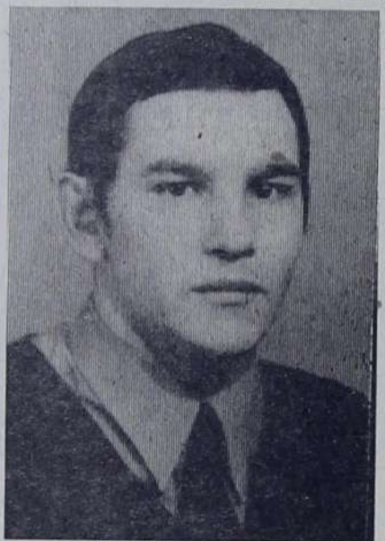
Фото и текст Ивана СИДОРЕНКО, Лидии ГОРОБЕЦ и Татьяны МАНЯЕВОЙ.