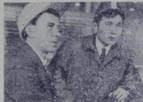
Казахская ССР. Успешно трудится во втором году пятилетки коллектив Чимкентского комбината асбестоцементных конструкций. Сверх задания изготовлены десятки километров труб, десятки тысяч плит шифера и много другой продукции.