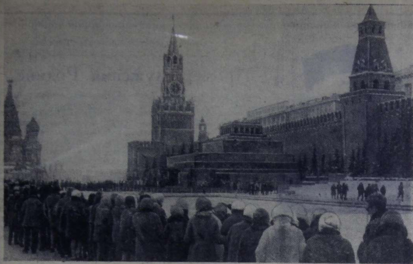
Москва. Красная площадь. Мавзолей В. И. Ленина.