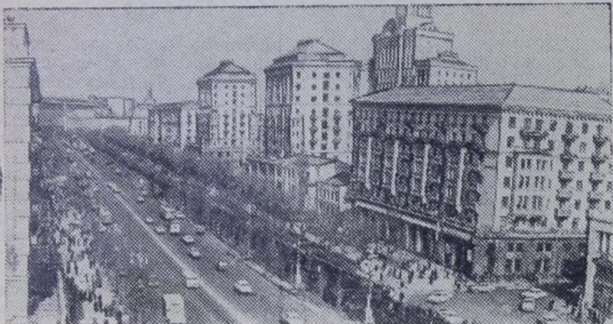
Киев — столица Украины. Центральная магистраль города — Крещатик.

Народная мудрость гласит: «Чем больше даешь, тем богаче становишься». Украина дает для народного хозяйства СССР магистральные тепловозы и радиотехническую аппаратуру, строительные материалы и минеральные удобрения,