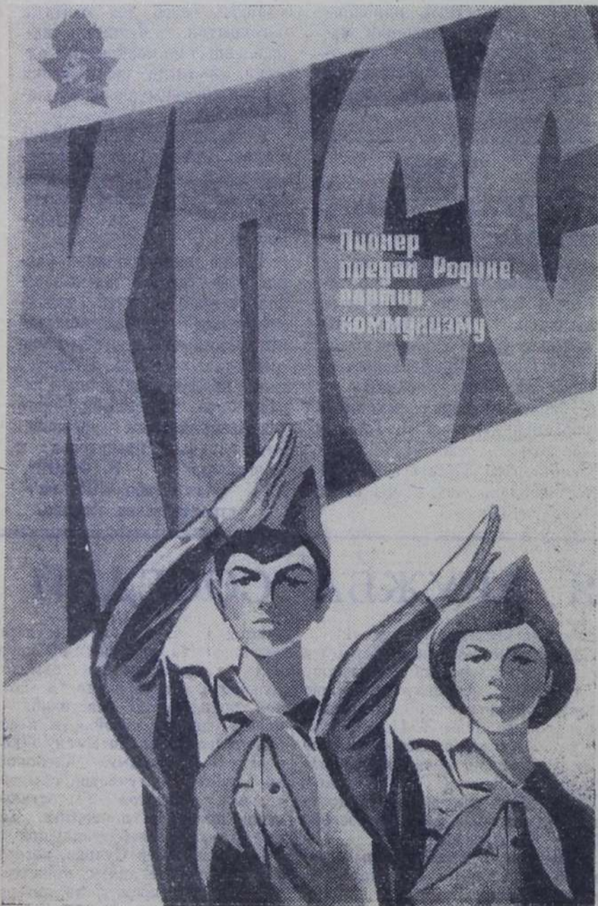
Плакат художника В. САЧКОВА (издательство «Изобразительное искусство»).

Адрес редакции: г. Балаково, Саратовской области, ул. имени Академика Жук, 12, телефон АТС, 40-43. Адрес полиграфического объединения «Авангард»: площадь имени Свердлова, 69, телефоны 40-51, 48-07. Заказ № 247.