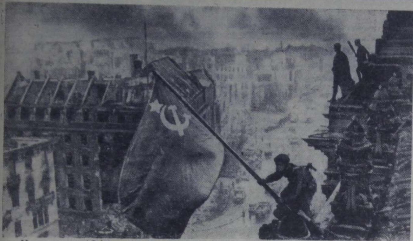
На снимке: 1945 год. Советский флаг над рейхстагом в Берлине.