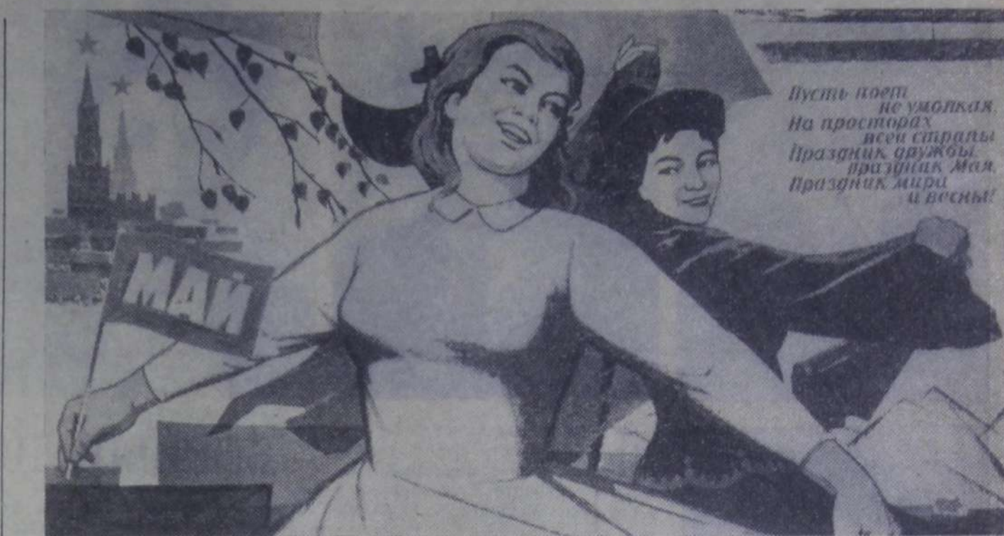
Плакат Е. Соловьева (Издательство «Изобразительное искусство»).

Для многотиражной газеты и стеновой печати Саратовгэстроя эти актуальные темы определяют главное направление. Укрепляя связь с работниками и читателями,