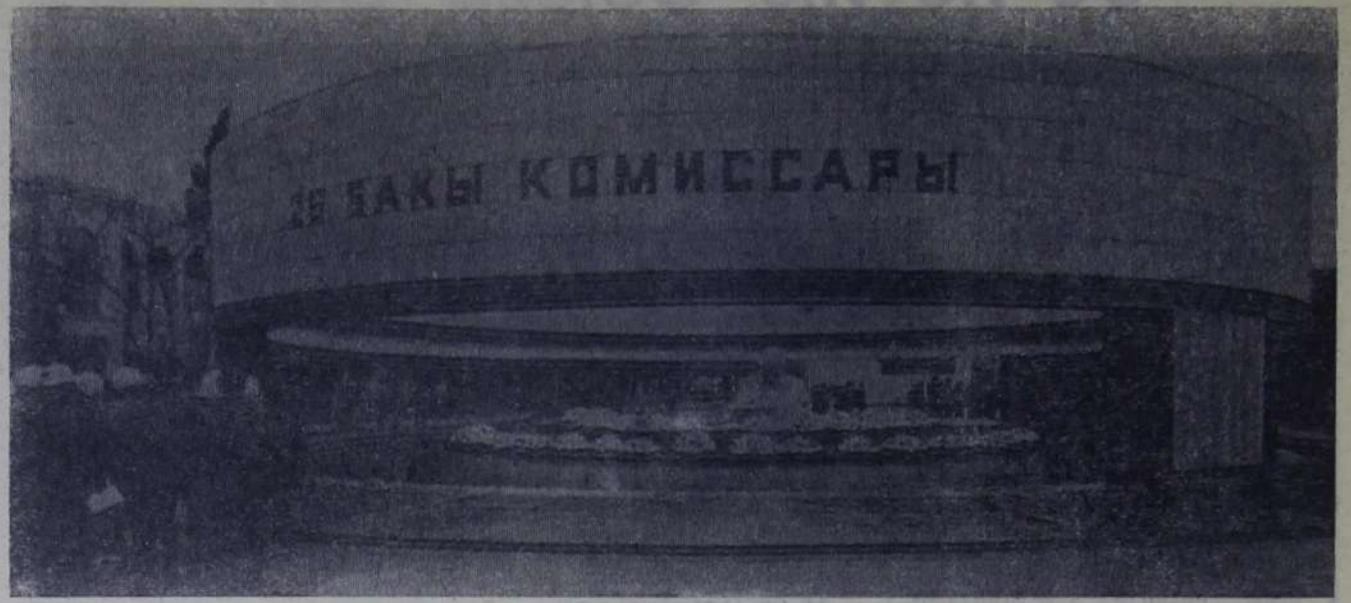
На снимках: памятник 26 бакинским комиссарам, у дома Лермонтова в Пятигорске.

Черноморское побережье гостеприимно встретило нас теплой, солнечной погодой. Некоторые смельчаки купались в море. Везде мы были очевидцами большого воодушевления, с которым народы Азербайджана, Грузии, России и других республик готовятся к славному юбилею — 50-летию образования Союза ССР.