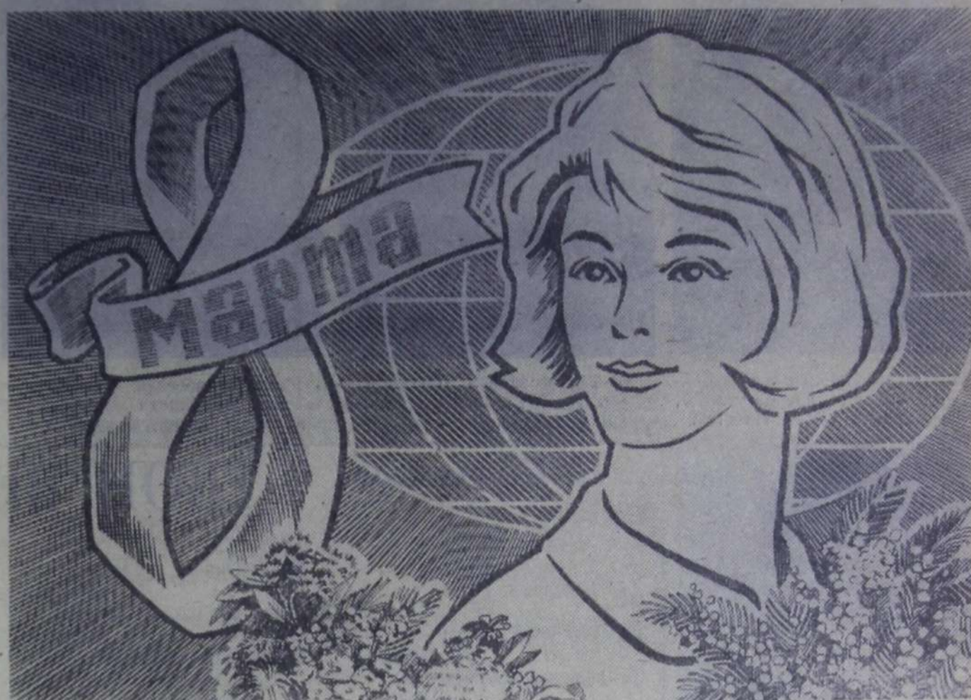
Рисунок художника С. Гринько.

В коллективе отдела рабочего снабжения преобладающее большинство составляют женщины. Особым вниманием к покупателям отличаются продавец Нина