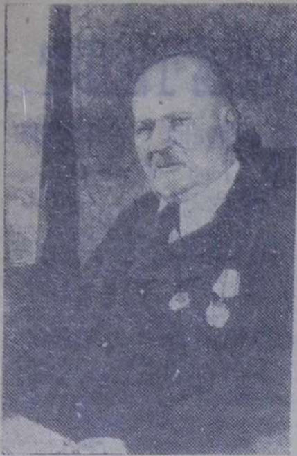
Наш календарь к 100-летию СО ДНЯ РОЖДЕНИЯ В. К. БЯЛЫНИЦКОГО- БИРУЛЯ

Москва, 29 февраля исполнилось 100 лет со дня рождения Витольда Казтановича Бялыницкого-Бирюля (1872-1957), советского живописца-пейзажиста, народного художника РСФСР и БССР, действительного члена Академии художеств СССР. С 1899 года В. К. Бялыницкий-Бирюля был экспонатом, а с 1905 года — членом Товарищества передвижных художественных выставок. Последователем И. И. Левитана, В. К. Бялыницкий-Бирюля развивал традиции русского лирического реалистического пейзажа.