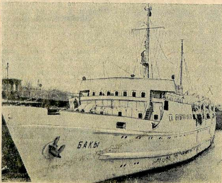
Дизель-электроход «Баки», сооруженный волгоградскими судостроителями.