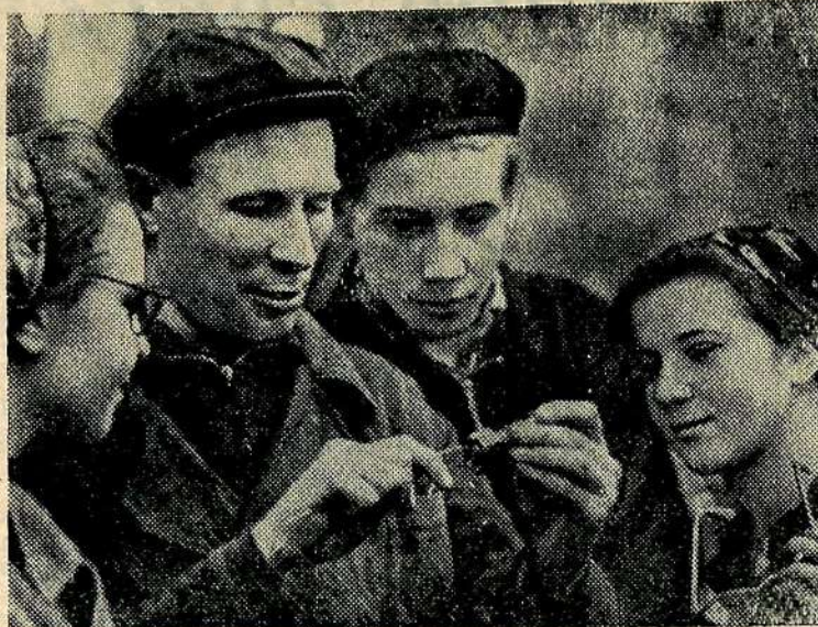
Старшеклассники Рязанской одиннадцатилетней школы № 17 проходят практику на заводе тяжелого кузнечно-прессового оборудования.

В механическом цехе в этом году для ребят оборудован специальный учебный участок.