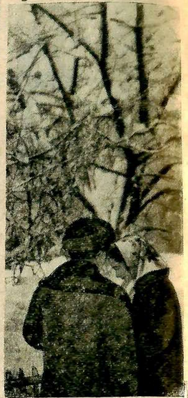
Зимний день.