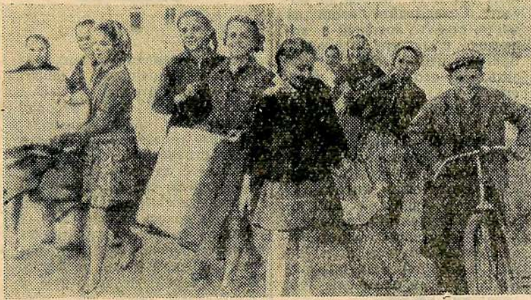
Хорошая осень стояла в этом году! В ясные и теплые сентябрьские дни школьники проводили свой досуг на свежем воздухе. Они не только играли, но и занимались полезными делами: собирали металлический лом и макулатуру. На снимке: пионеры и школьники 38-й школы за сбором макулатуры.

Недавно шефы подарили своим подшефным набор слесарного инструмента, необходи-