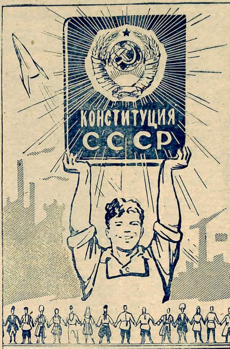
Плакат В. Жаринова.

Выступая на сессии, товарищ Н. С. Хрущев указал, что основные задачи Конституции «состоят в том, чтобы отразить новый этап в развитии советского общества и государства, поднять на еще более высокий уровень социалистическую демократию, создать еще более прочные гарантии демократических прав и свобод трудящихся, гарантии строгого соблюдения социалистической законности, подготовить условия для перехода к общественному коммунистическому самоуправлению».