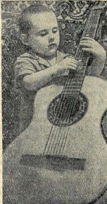
Юный гитарист.