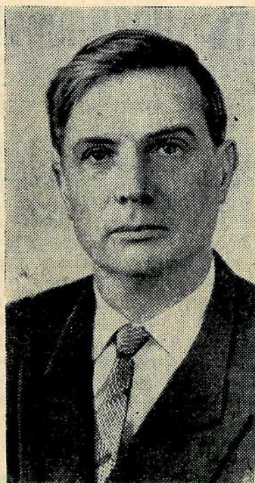
Член Президиума ЦК КПСС, секретарь ЦК КПСС Сулов М. А.