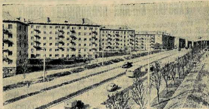
Проспект Столетия Владивостока в новом Северо-Западном районе города.

Но героизм Народно-революционной армии и партизан опрокинул вооруженные полчища интервентов—американских, японских и иных любителей чужого добра. Последний оплот мирового империализма, вторгшегося в пределы советской земли, рухнул под