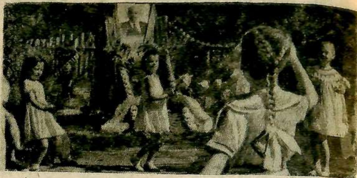
В детсаду завода имени Ф. Э. Дзержинского.