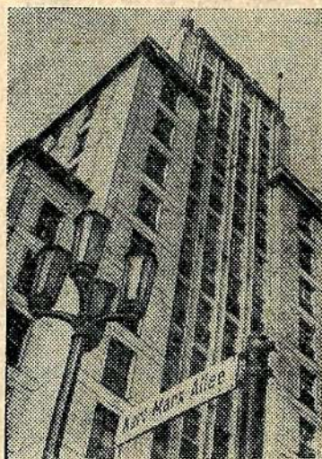
Берлин. Высотное здание на Карл-Маркс-аллее.

Провокации со стороны воздушного пирата подверглось также кубинское судно „Плайя-Хирон“.