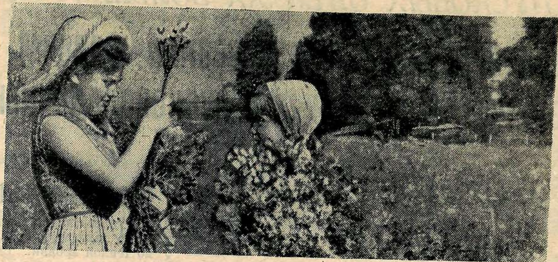
Последние погожие дни