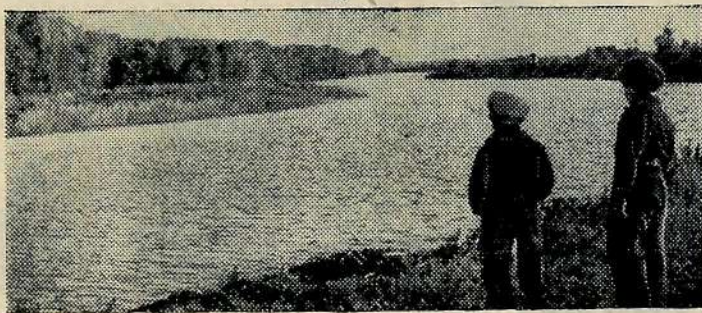
И осенью красив многоводный Иргиз!