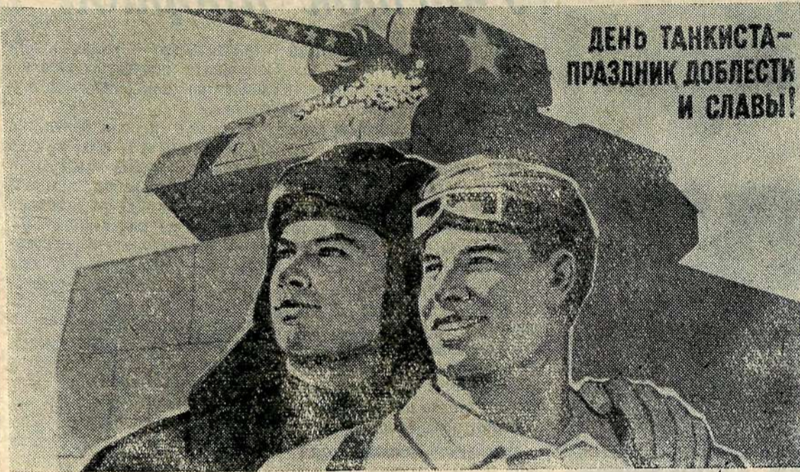
ДЕНЬ ТАНКИСТА— ПРАЗДНИК ДОБЛЕСТИ И СЛАВЫ!