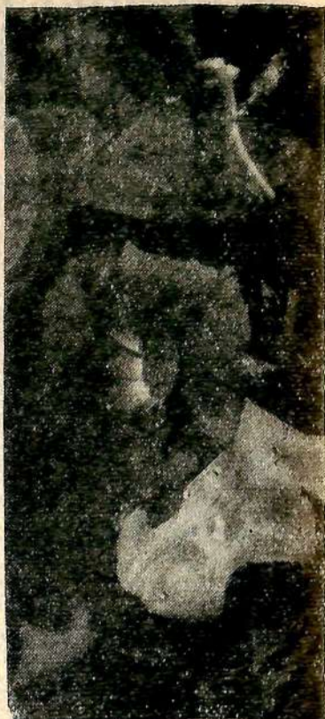
Последние цветы