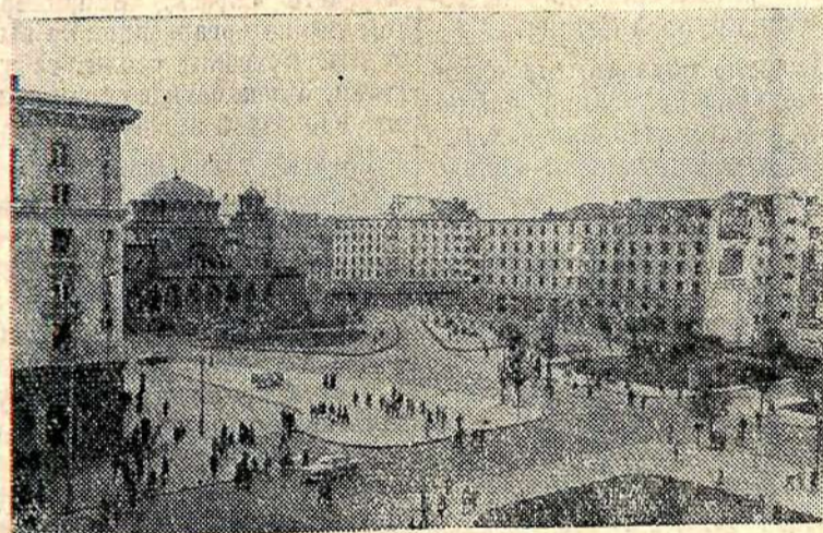
Народная Республика Болгария. Площадь имени Лени на в Софии.

В 1961 году кинотеатры Болгарии посетили 119 миллионов зрителей, а в 1939 году — только 13 миллионов. В 1965 году число стационарных кинотеатров достигнет 2200, а до войны их было 213. В 1961 году Болгария участвовала в 15 международных кинофестивалях.