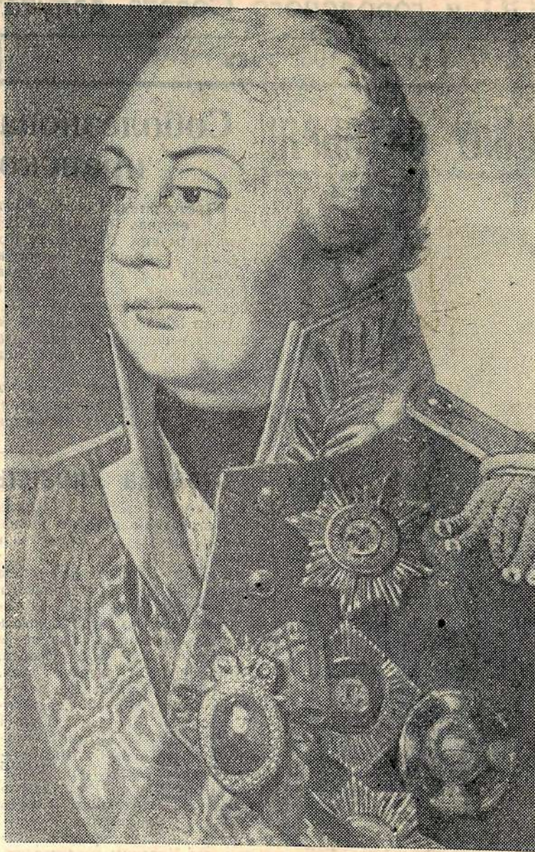
Великий русский полководец Михаил Илларионович Кутузов.

Уроки бесславного наполеоновского похода на Москву поучительны и в наши дни. История на примере судеб захватнических армий Наполеона и Гитлера учит, что сумасбродные попытки претендовать на мировое господство неизбежно кончатся крахом, разбиваясь о стойкость широких народных масс, их непреодолимое стремление к свободе и независимости.