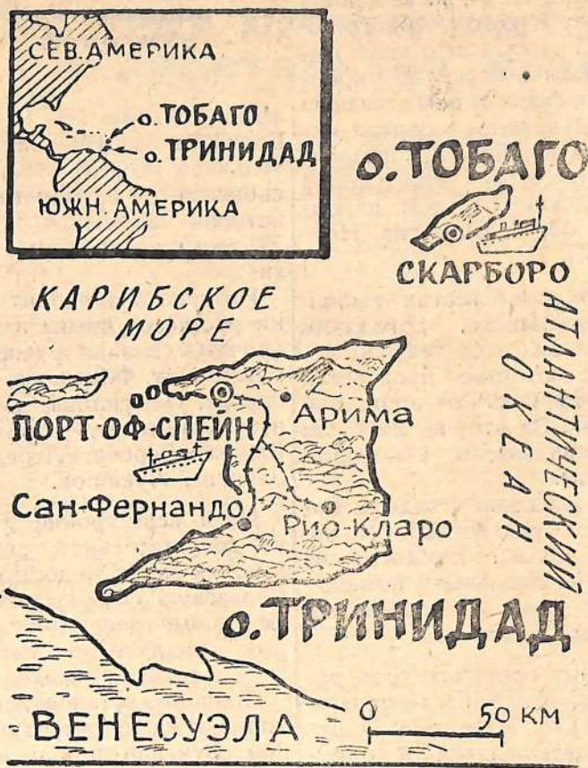
К провозглашению независимости Тринидада и Тобаго. Рис. А. Ведерникова.