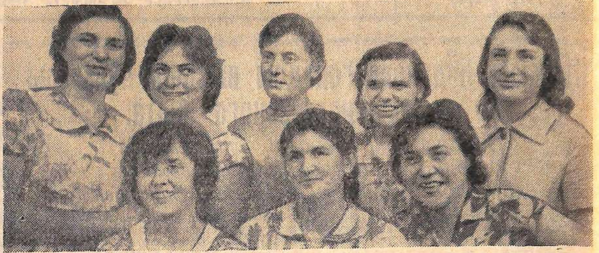
На опытной установке комбината искусственного волокна работает молодежь. Юноши и девушки вкладывают много энергии и огонька в свой труд. В этом дружном коллективе более 30 человек борются за звание ударников коммунистического труда. На снимке: молодые работницы ткацкого цеха.