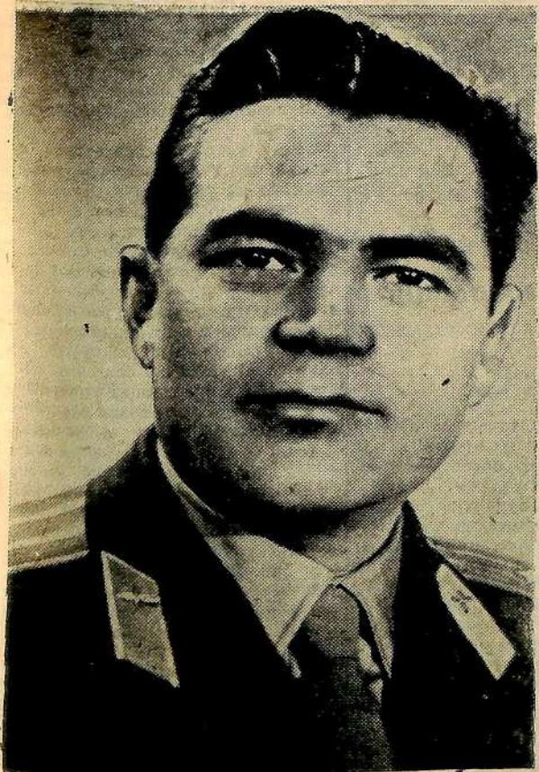
Пилот космического корабля «Восток-3» летчик-космонавт майор Андриян Григорьевич НИКОЛАЕВ.

Центральный Комитет КПСС Президиум Верховного Совета СССР Совет Министров СССР