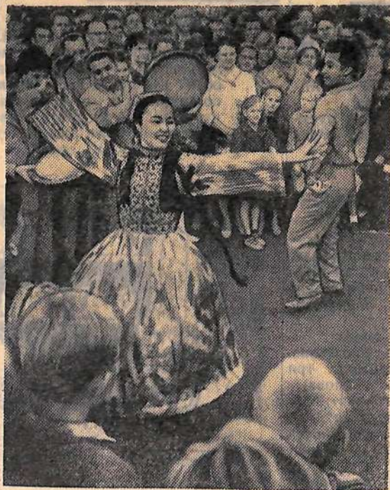
VIII Всемирный фестиваль молодежи и студентов. На снимке: народное искусство Узбекистана, демонстрируемое прямо на улице финской столицы, привлекло многочисленных зрителей.