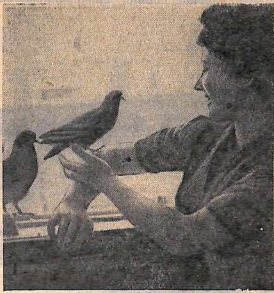
В часы досуга у открытого окна.

В один из мартовских дней этого года ранним утром в красный уголок, где я занималась разборкой газет, вошел расстроенный юноша. Он рассказал мне о том, что мать прислала ему письмо, в котором просила его покинуть