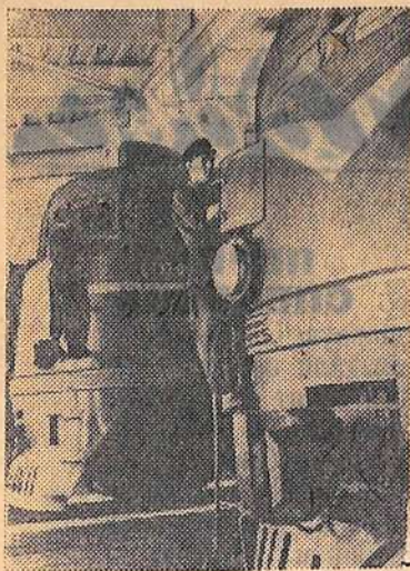
Аткарское локомотивное депо Приволжской железной дороги перешло на тепловозную тягу. На снимке: в тепловозном цехе Аткарского депо.