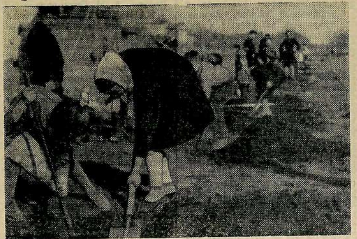
Учащиеся городской школы № 10 за подготовкой ямок для посадки деревьев. Они подготовили их более 200.