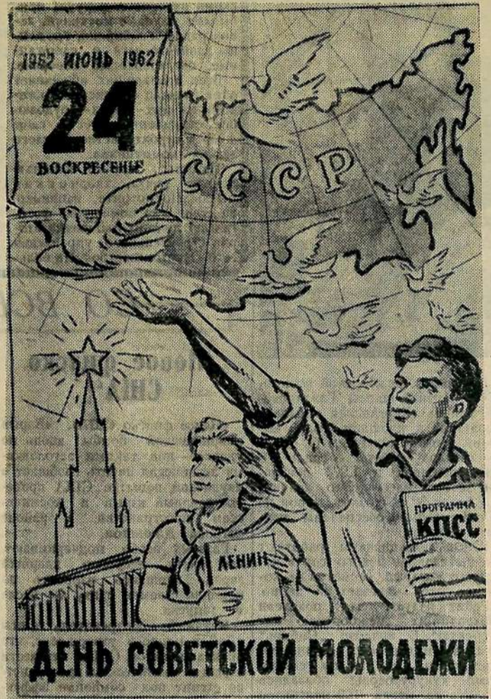
Рисунок В. Жарикова.

Вдохновляемая величественной Программой партии, вооруженная решениями XIV съезда ВЛКСМ, советская молодежь сделает все, чтобы приблизить победу коммунизма — самого счастливого общества на земле.