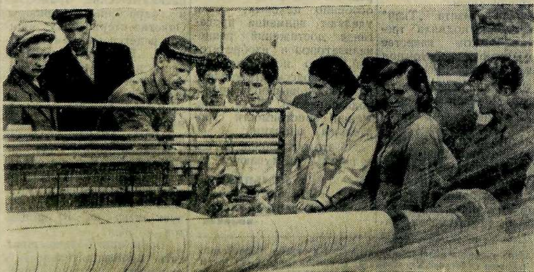
Молодые строители комбината искусственного волокна, прибывшие из Одессы по комсомольским путевкам, в часы досуга знакомятся с

По докладу собрание партактива приняло развернутое решение, направленное на коренное улучшение воспитательной работы среди населения.