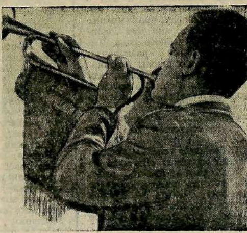
Собирайся, пионерия, в поход!

Дежурные пионеры сервируют столы. На каждом из них стоят букеты цветов. Ребята хорошо выполняют режим. Ежедневно по утрам проводят зарядку. А. БОДРОВА, фельдшер пионерского лагеря "Дружба".