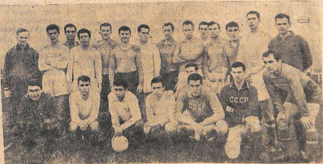
Сборная команда СССР — участница розыгрыша первенства мира по футболу в Чили.

Государства — участницы Варшавского Договора заявляют, что они, как и прежде, стоят за решение проблем, разделяющих государства, мирным путем, путем переговоров, и надеются, что такой же трезвый подход к решению этих проблем будет проявлен и со стороны западных держав. Но в случае, если ответом на их такую миролюбивую политику будут действия, направленные против интересов их безопасности, против суверенных прав Германской Демократической Республики, против интересов мира, то они полны решимости достойным образом оградить свою безопасность и защитить мир всеми имеющимися в их распоряжении средствами.