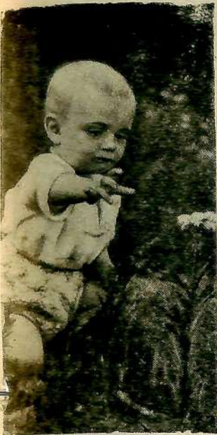
Быть ему мичуринцем.