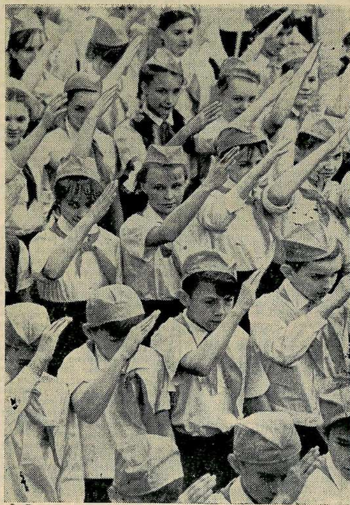
Советская пионерия.