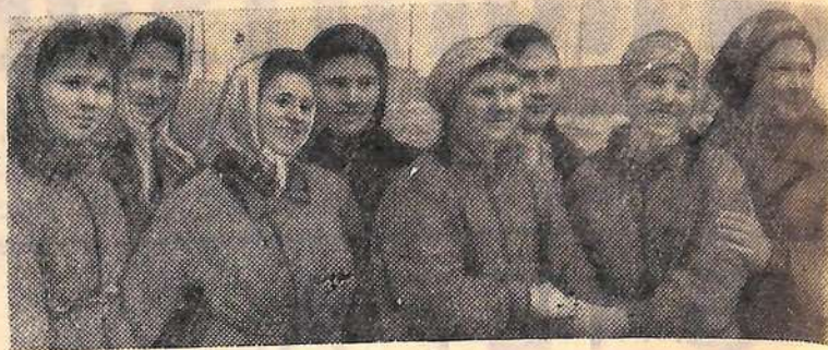
Молодые строительницы Балаковского комбината искусственного волокна.

А. СЫЗРАНЦЕВ, бригадир комплексной бригады стройуправления № 6.