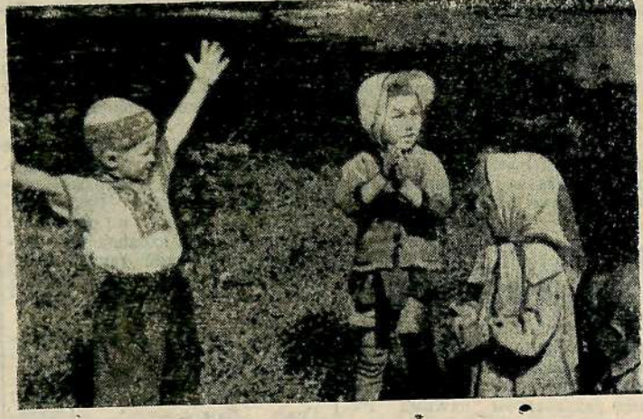
Пришла весна с цветами, мягкой изумрудной травой, солнечными теплыми днями. Много времени проводят на воздухе малыши. Видите, как один из них проводит занятые гимнастикой? Помогите ему, друзья-пионеры!