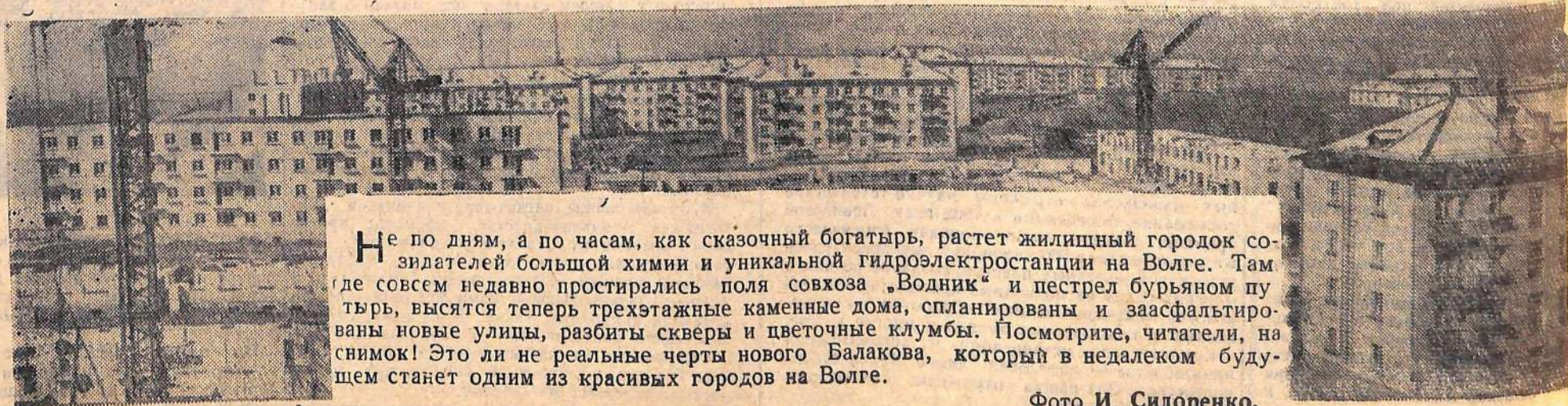
Не по дням, а по часам, как сказочный богатырь, растет жилищный городок создателей большой химии и уникальной гидроэлектростанции на Волге. Там где совсем недавно простиралась поля совхоза „Водник“ и пестрел бурьяном путь, высятся теперь трехэтажные каменные дома, спланированы и заасфальтированы новые улицы, разбиты скверы и цветочные клумбы. Посмотрите, читатели, на снимок! Это ли не реальные черты нового Балакова, который в недалеком будущем станет одним из красивых городов на Волге.