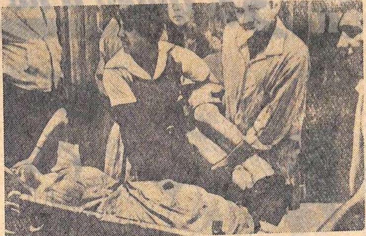
Молодежь Гватемалы выступает против ненавистного режима Идигораса Фуэнтеса. Студенты и молодые рабочие провели демонстрацию на улицах города Гватемала. Они были жестоко избиты полицейскими.